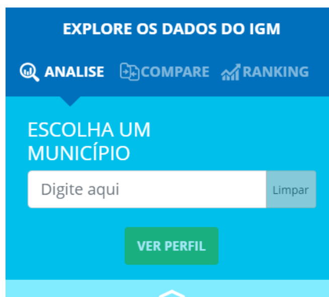
Figura 3 – Explore os dados do IGM

Na opção ANALISE, basta digitar o nome do município que se deseja analisar, logo aparecerá o nome do município, basta clicar em cima do nome do município e em seguida clicar em VER PERFIL.