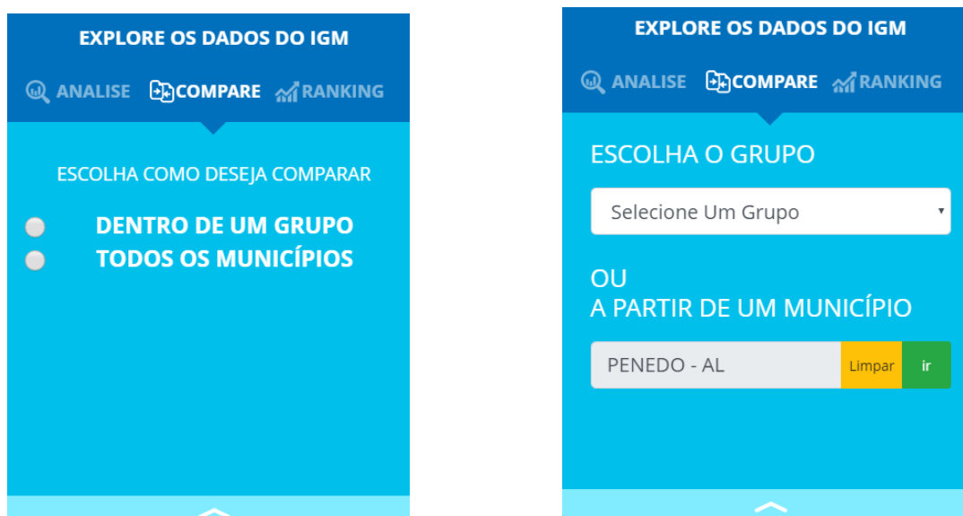
Figura 4 – Escolha como deseja comparar

Na opção COMPARE inicialmente você terá que optar entre dois tipos de comparação DENTRO DO GRUPO ou TODOS OS MUNICÍPIOS.