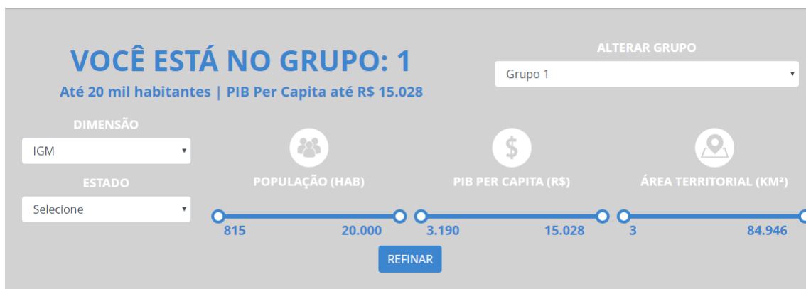
Figura 7 – Ajuste fino do ranking

Ainda é possível realizar um ajuste fino delimitando a busca por municípios dentro de uma determinada faixa populacional, PIB per capita e área territorial, conforme figura a seguir: